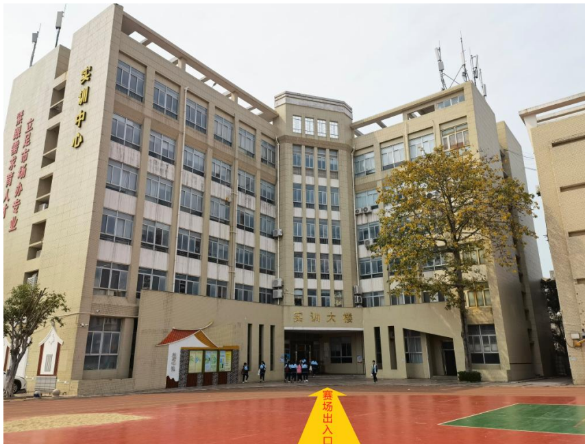
实训大楼-赛场位置