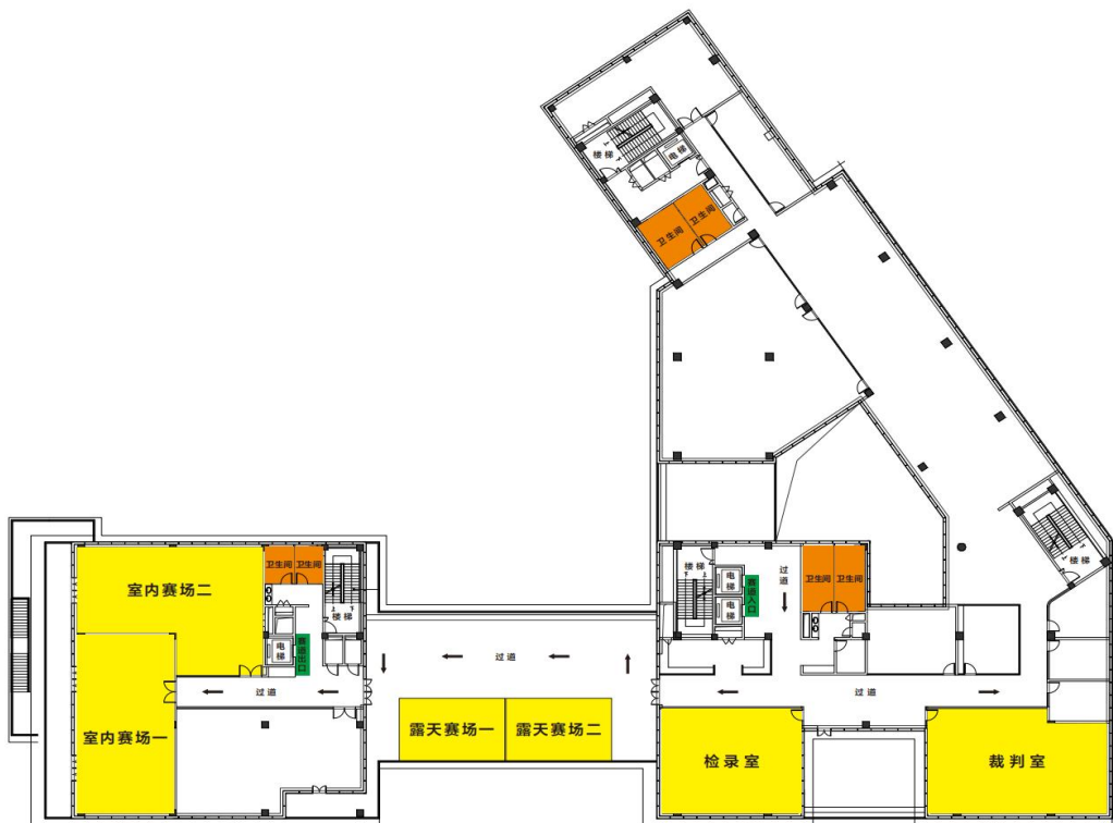
产创融合基地五楼布局图