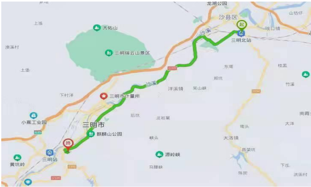
图 2 三明北站至三明林校路线图