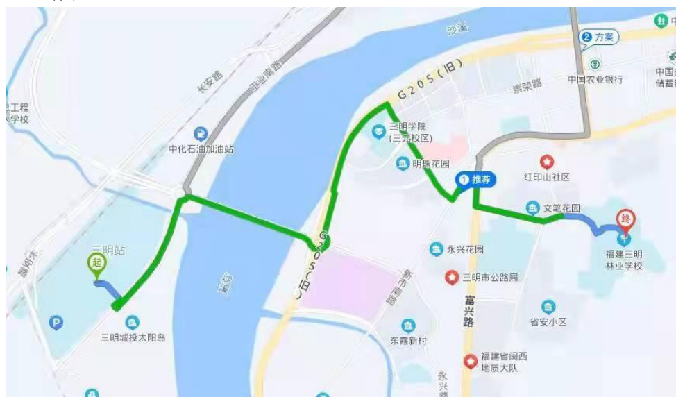
图 1 三明站至三明林校路线图

2. “三明北站” 乘坐 K102 路公交车到终点站，随后转乘 19 路公交车至“林业学校”站点，全程约 35 公里（如图 2 所示）。