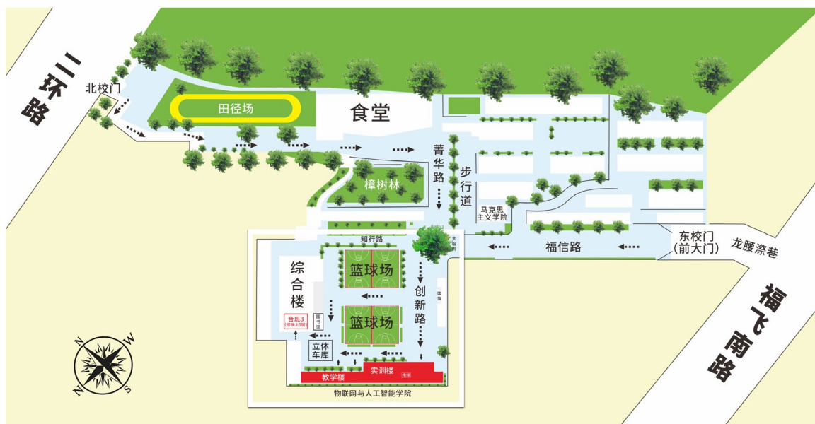
福建信息职业技术学院（龙腰校区）