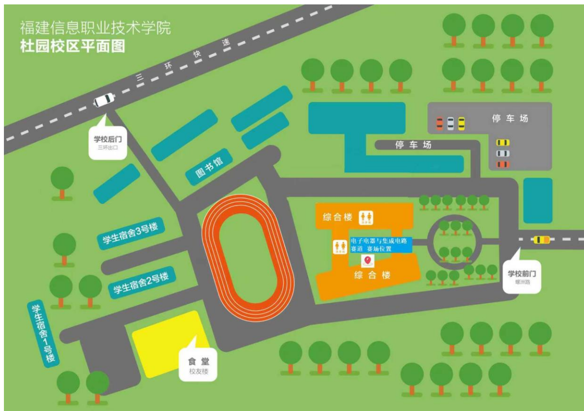
图1 校区和赛场位置