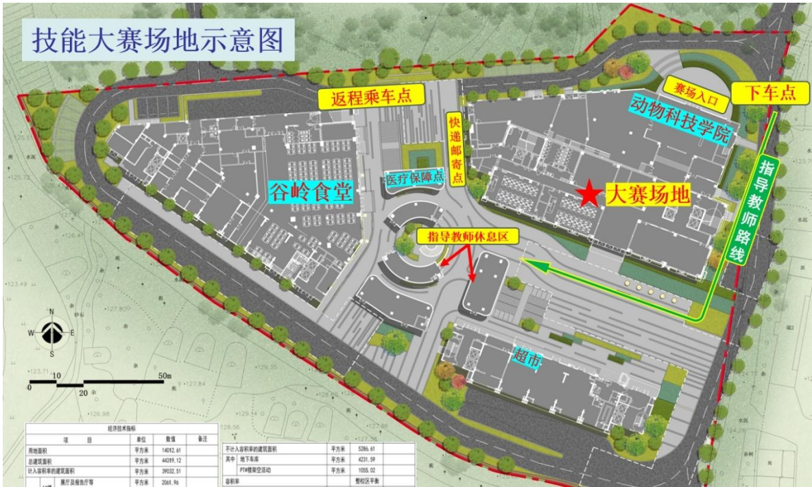
技能大赛场地示意图