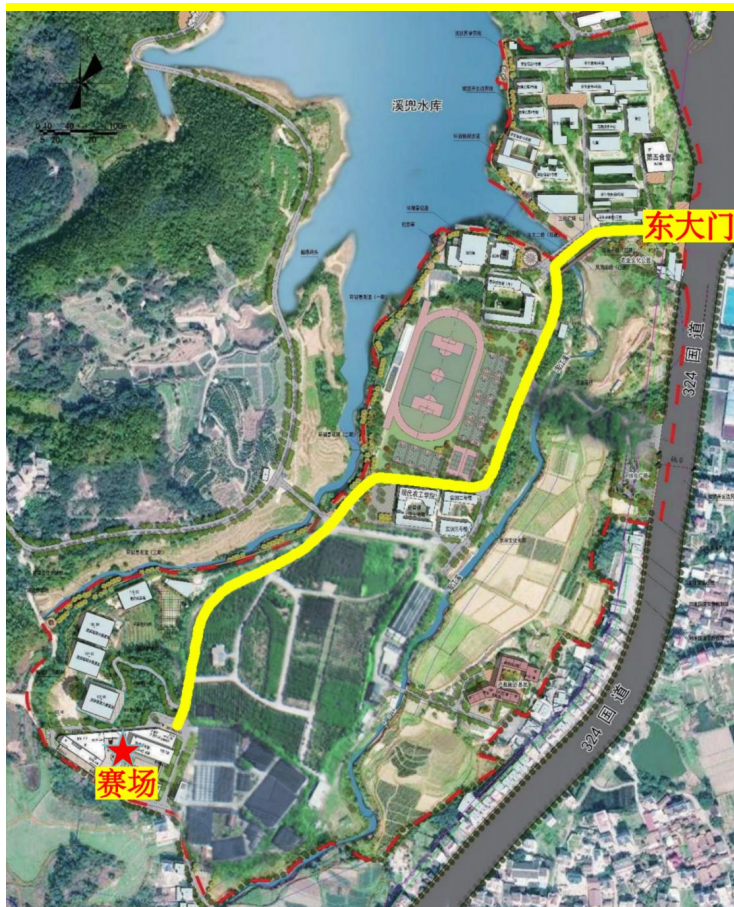
校门口到赛场示意图